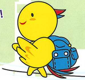
防災マスコットはぼたん