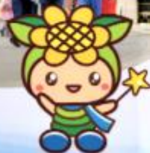
佐用町の観光イメージキャラクターおきよん