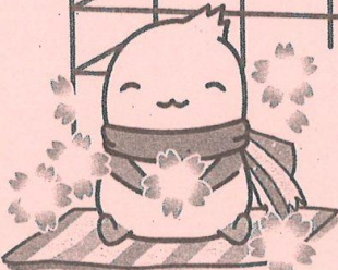
養父市イメージキャラクター やっぶー